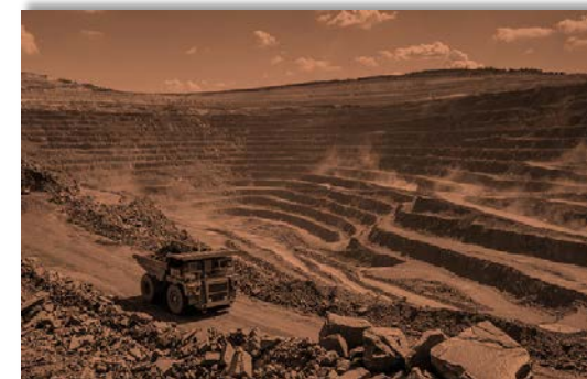
ЖЕЖЕЛІВСЬКИЙ ТА ХУСТСЬКИЙ КАР'ЄРИ